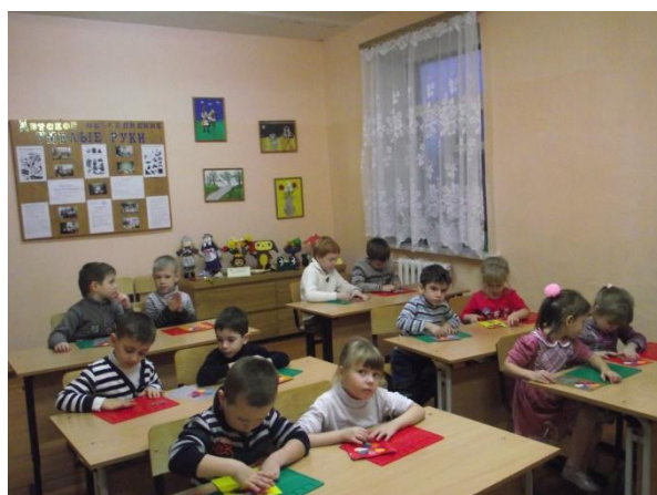
- «Мастерская чудес»,