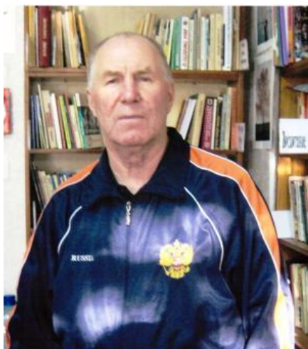
- «Настольный теннис»,