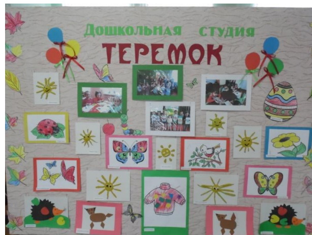
- дошкольная студия «Теремок»,