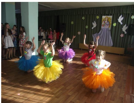
- «Современные танцы»,