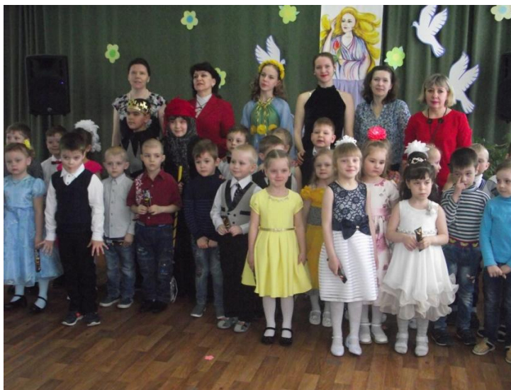
- дошкольная студия «Малышок»,