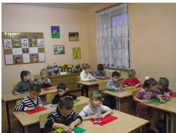
- «Умелые руки»,