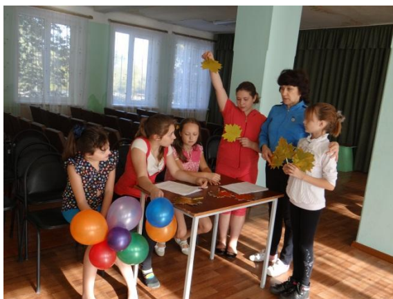
- «Мастерская досуга»,