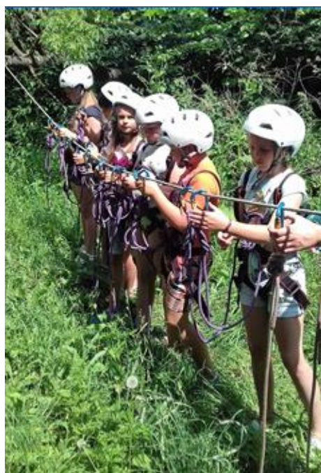
- «Туризм и краеведение»,