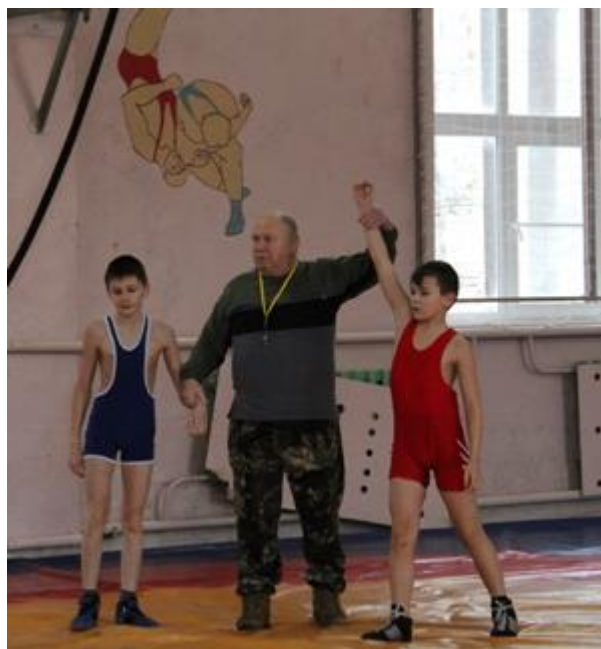
- «Греко-Римская борьба»,