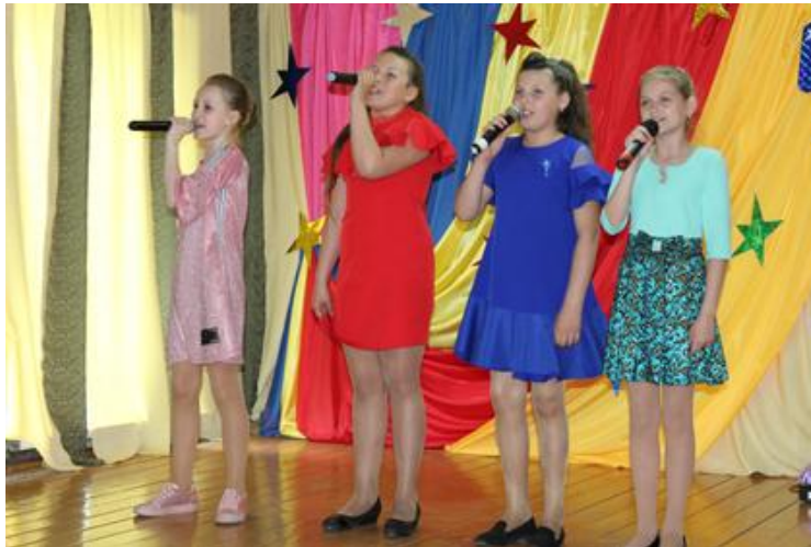
- «Эстрадная песня»,