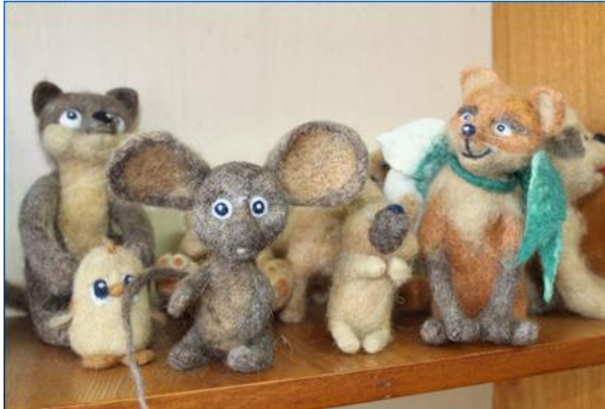
- «Кукольный микс»,