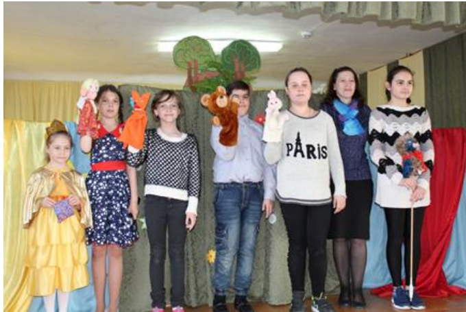
- театральная студия «Браво»,